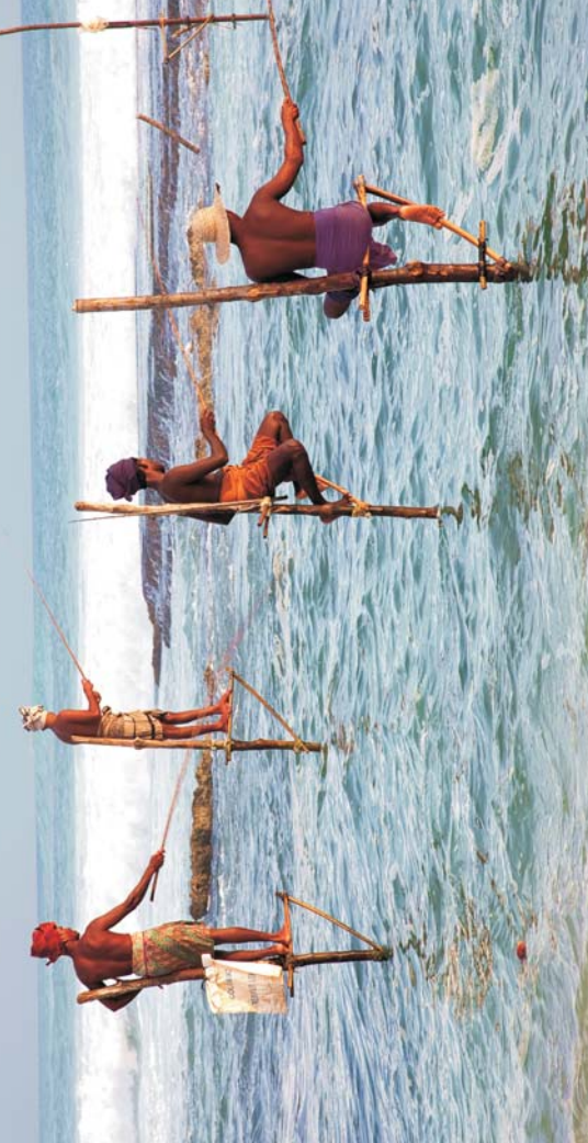
Titelbild: Steinfischer am indischen Ozean